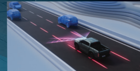
ใหม่! LKAS (Lane Keep Assist System) ระบบช่วยควบคุมรถให้อยู่ในเลน