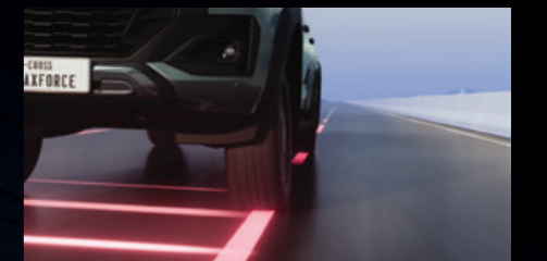
ใหม่! LDP (Lane Departure Prevention) ระบบช่วยควบคุมรถไม่ให้ออกนอกเลน พร้อม LDW (Lane Departure Warning) ระบบช่วยแจ้งเตือนเมื่อรถออกนอกเลน