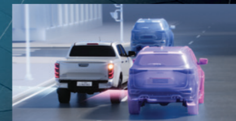
ใหม่! ELK (Emergency Lane Keeping) ระบบช่วยควบคุมรถให้อยู่ในเลน ในสถานการณ์ฉุกเฉิน