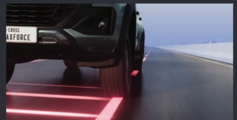
ใหม่! LDP (Lane Departure Prevention) ระบบช่วยควบคุมรถไม่ให้ออกนอกเลน พร้อม LDW (Lane Departure Warning) ระบบช่วยแจ้งเตือนเมื่อรถออกนอกเลน