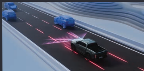
ใหม่! LKAS (Lane Keep Assist System) ระบบช่วยควบคุมรถให้อยู่ในเลน

หนึ่งเดียว! ที่มั่นใจ แบบฉบับไอซูซุ ด้วยเทคโนโลยีระบบความปลอดภัยเพื่อการขับขี่ใหม่ล่าสุด! ระบบช่วยเหลือผู้ขับขี่ ADAS ด้วย 3D Imaging Stereo Camera ที่มีมุมมองกว้างและแม่นยำกว่าเดิม พร้อมเรดาร์ 2 จุด และเซ็นเซอร์ 8 จุดรอบคัน