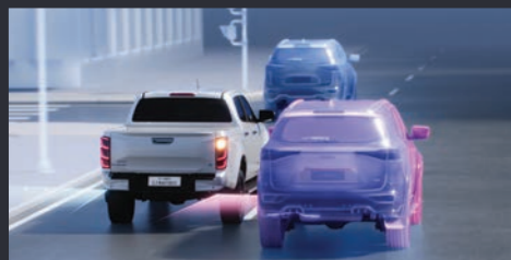
ใหม่! ELK (Emergency Lane Keeping) ระบบช่วยควบคุมรถให้อยู่ในเลน ในสถานการณ์ฉุกเฉิน